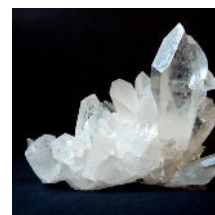
Optische kristal Technologie